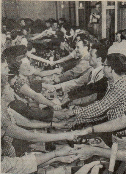
Het Grote Ontmoeten. Jongeren van alle nationaliteiten vieren uitbundig feest tijdens de talrijke ontmoetingen met de Sowjet-jeugd in 1957.

„Die angst speelde heel nadrukkelijk. Ze weten daar dat sommige Westeuropese jongeren het festival als een goede gelegenheid zien om kwesties als dissidenten, Polen en Afghanistan aan de orde te stellen. Wij willen dat niet provocatief. Mede op ons verzoek behandelt één van de thematische centra „de mensenrechten, tien jaar na Helsinki“. Dat biedt voldoende gelegenheid onze kritiek te spuien.”