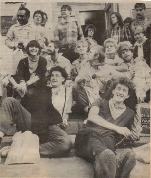
Leden van de Nederlandse delegatie op bezoek bij de Moskouse Filmacademie

Onze beide medewerkers verzorgden ook de verslaggeving voor De Waarheid over het festival vanuit Moskou.