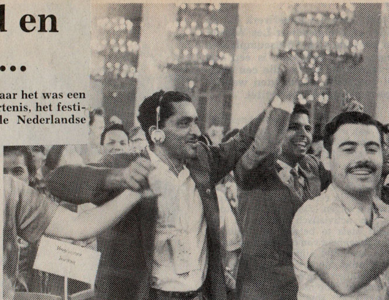
„Vriendschap”, het werd in vele toonaarden herhaald

„Ik vond het festival inspannend en enerverend. Helaas kon ik maar weinig deelnemen, want er waren veel problemen, waarvoor ook veel oplossingen gevonden moesten worden en gevonden zijn.” „Onze deelname is goed geweest omdat leden van de delegatie de gelegenheid hebben gehad om belangrijke zaken aan de orde te stellen. Denk maar aan de homojongeren; het is van historisch belang dat in de Sowjet-Unie homoseksualiteit aan de orde gesteld kon worden.” „De belangrijkste reden voor onze deelname was de internationale ontmoeting van jongeren en die heeft ruimschoots plaatsgevonden.”