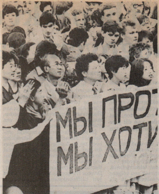
Japanse delegatielieden uiten hun protest tegen kernwapens