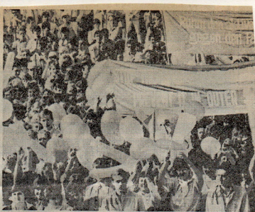
Parade van de deelnemers aan het jeugdfestival in Moskou.

In Moskou was er veel ergernis over de demonstratieve geste die de Sowjets hadden gemaakt tegenover de Westduitse delegatie. Maar daarnaast kreeg een deel van de Nederlandse delegatie wel alle gelegenheid op visite te gaan bij de Moskouse dissidente