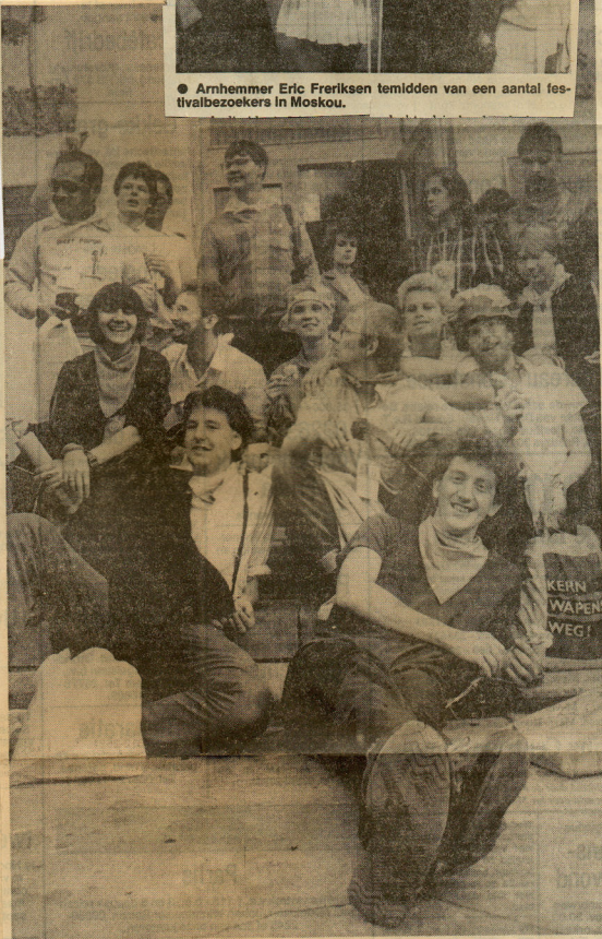
● Na vermoedende debatten rust de themagroep cultuur even uit.