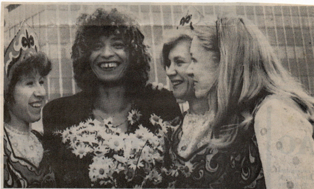
Festivaldeelnemster Angela Davis, strijdster voor de rechten van de negers in de Verenigde Staten, temidden van enkele Russische meisjes.